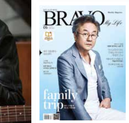
Model 정동환 Stylist 이서연 Dress 자켓·셔츠(자라맨), 팬츠(띠어리), 안경(뮤지크) Hair&Makeup 이주안 Editor 김영순