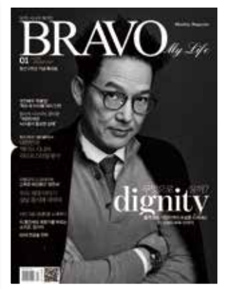
Model 함익병 Stylist 박정아 Hair & Makeup 이주안

셔츠와 타이는 S.T.듀폰 클래식. 하이넥 풀오버 139만원, 캐시미어 코트 450만원 S.T.듀폰 파리. 모나코 칼리버 12 크로노그래프 워치 600만원대 태그호이어.